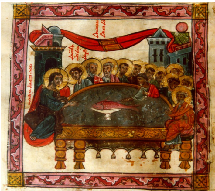
"The Mystical Supper" (miniature from the Monastery Mar Gabriel in Tur Abdin)

Vat. Syr. 66, foglio 101 recto [numerato 103] (RETROVERSIONE LATINA) « Super corpus. Dominus noster Iesus Christus, nocte qua traditurus erat et pridie quam pateretur, accepit panem hunc sanctum in manus suas puras et sanctas, et elevavit oculos suos in caelum, et gratias egit Deo Patri, factori omnium, et benedixit ac fregit deditque discipulis suis et dixit: Accipite, comedite vos omnes ex hoc pane: HOC EST IN VERITATE CORPUS MEUM. Et elevans aliquantulum calicem supra altare dicit super calicem: Et similiter, postquam caenatum est, accepit hunc calicem in manus suas puras, et gratias egit, et benedixit, deditque discipulis suis et dixit: Accipite, bibite vos omnes ex hoc calice; et quotiescumque comederitis hunc panem et biberitis etiam hunc calicem, memoriam meam facietis: HIC EST IN VERITATE CALIX SANGUINIS NOVI TESTAMENTI, QUI PRO VOBIS ET PRO MULTIS EFFUNDETUR IN VENIAM DEBITORUM ET IN REMISSIONEM PECCATORUM. Et hoc erit vobis pignus in aeternum. Et deinde: Gratia Domini nostri Iesu Christi et caritas Dei Patris et communicatio Spiritus Sancti sit vobiscum, nunc. Et signat seipsum. »